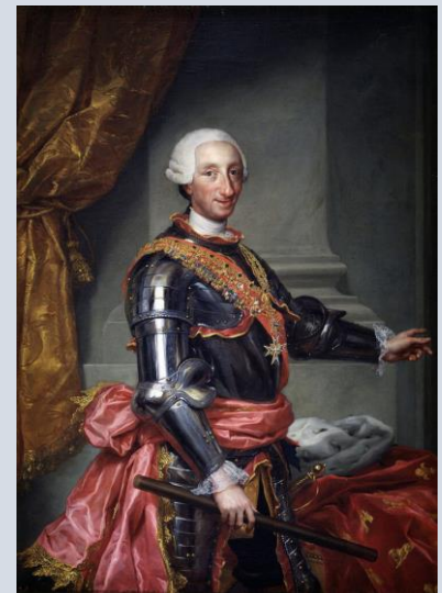
Retrato del rey Carlos III de España (1716-88)