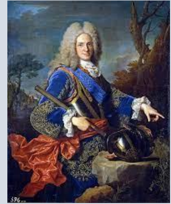
Retrato de Felipe V

Las reformas borbónicas se orientaron a incrementar el poder del Estado, aminorar la influencia política de la aristocracia, resucitar el poderío bélico español en Europa y recuperar sus colonias americanas. Estas medidas se iniciaron con Felipe V y alcanzaron su fase más radical durante el gobierno de Carlos III, abarcando los ámbitos de la administración de los territorios en América.