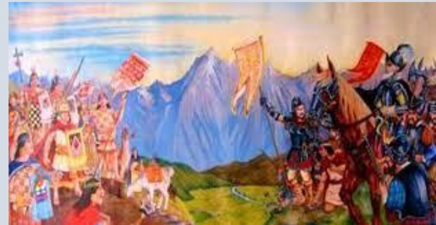
Victoria de Sangarará

Acto seguido, Túpac Amaru II se puso en marcha hacia el norte contando con la simpatía y adhesión de los pobladores que, en su mayoría, estaban armados de picos, palos, hachas y sólo algunas armas de fuego. En estas condiciones, ganó la batalla de Sangarará, librada el 18 de noviembre de 1780. Pero no quiso todavía dirigirse al Cuzco y prefirió retirarse a Tinta donde el día 27, lanzó un manifiesto explicando las causas que le habían llevado a la sublevación.