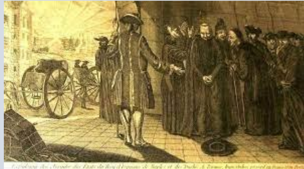
Expulsión y exilio de los jesuitas de los dominios de Carlos III