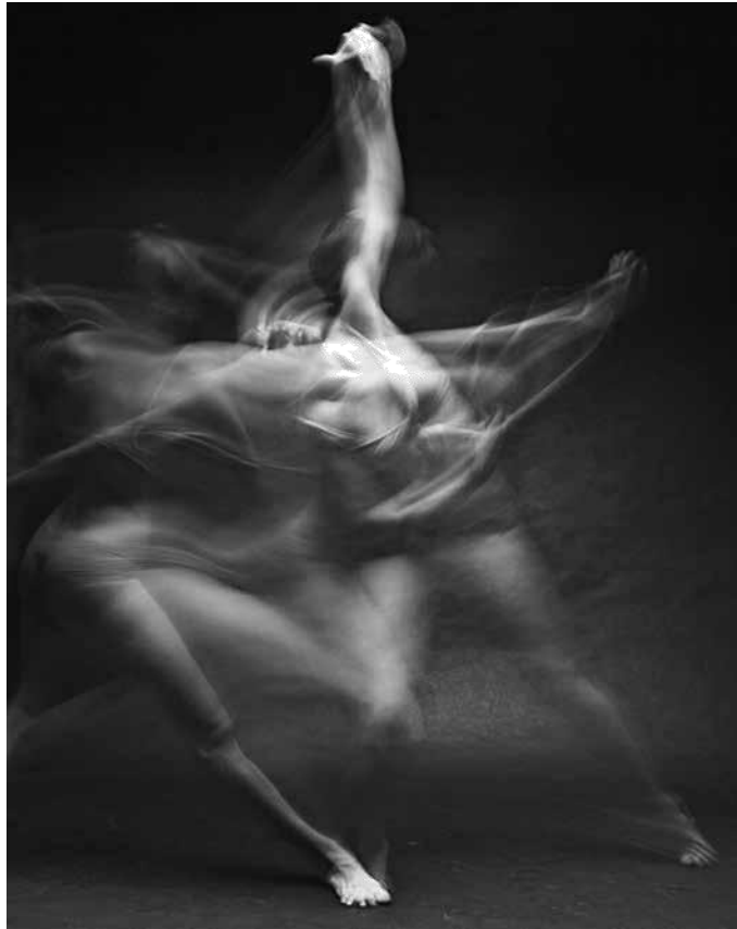
Fotografía de la serie Motion de Bill Wadman. Recuperada de https://tinyurl.com/yc9x6um8

¿Cuál es el recurso visual que más destaca en la siguiente fotografía de Bill Wadman (Estados Unidos, 1975)?