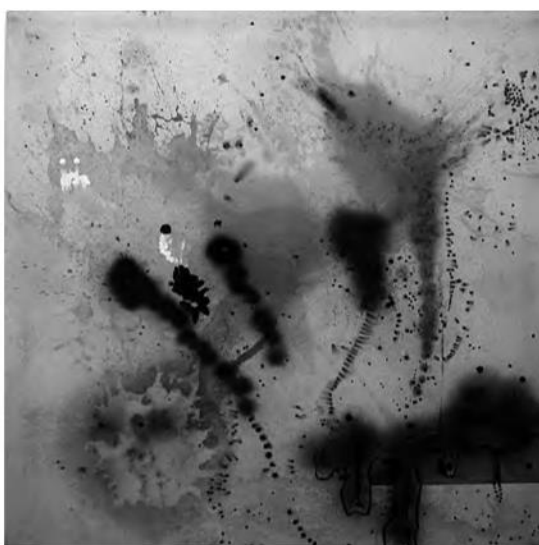
Rodríguez Larraín, E. (2006). Sin título .