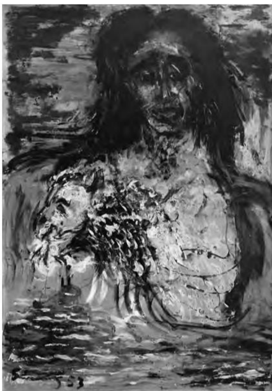
Gutiérrez, S. (1953). Bruja de Cachiche .