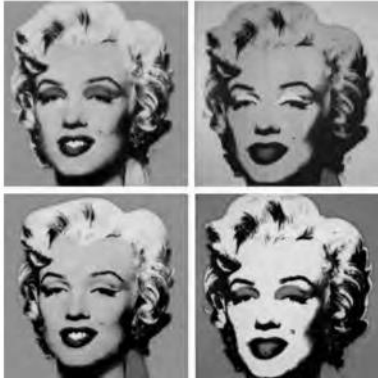
Warhol, A. (1967). Serie Marilyn Monroe .