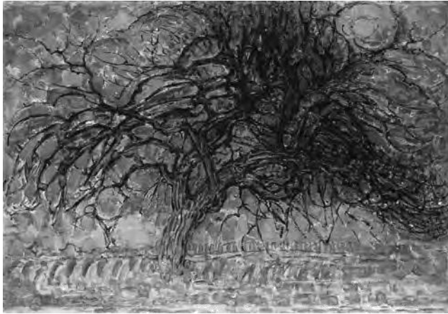
El árbol rojo (1908).

A continuación, se presentan tres pinturas realizadas por Piet Mondrian en las que el autor representa un árbol. Observe las imágenes y responda la pregunta.