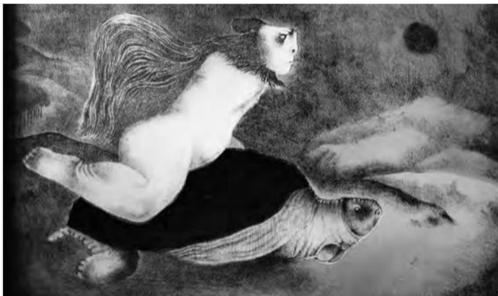
Tsuchiya, T. (1974). El mito de los sueños .