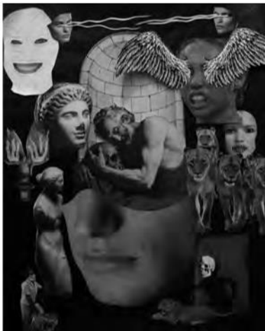
Swofford, J. (2017). San Jerónimo abraza su propia mortalidad .