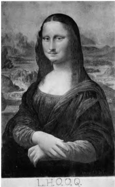
Duchamp, M. (1919). L.H.O.O.Q.