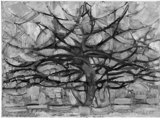
El árbol gris (1911).